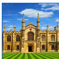
Universidade de Cambridge