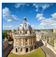
Universidade de Oxford