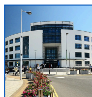
Brunel University London