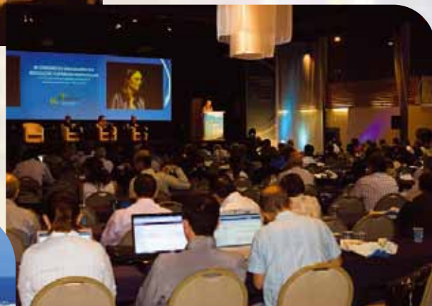
Florianópolis/SC – 2010