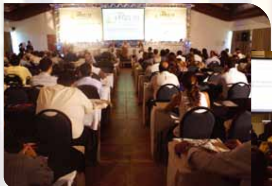
Porto de Galinhas/PE – 2008