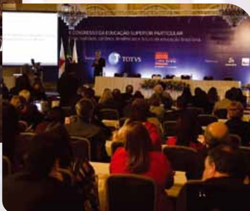
Araxá/MG – 2009