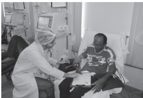
Aluna bolsista da Unifor em atendimento a paciente do IDR, Instituto de doenças Renais

A diálise peritoneal usa a membrana peritoneal como um filtro natural, que em contato com uma solução especial, colocada no abdome através de um tubo (cateter), é capaz de promover a retirada de escórias, e gerar o