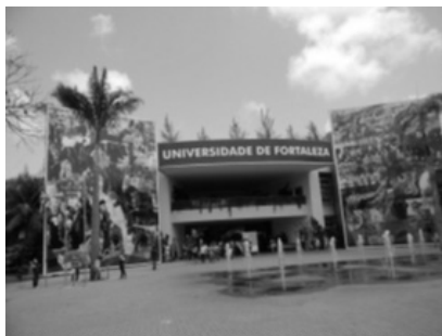
Universidade de Fortaleza

O “Projeto Educação e Saúde na Descoberta do Aprender” implementado pela Unifor, instituição localizada na cidade de Fortaleza/CE, busca amenizar a dor, a angústia e a ansiedade de crianças, jovens e idosos que se submetem ao tratamento renal, via hemodiálise. O projeto, implementado desde o ano de 2000, oferece ainda aos pacientes