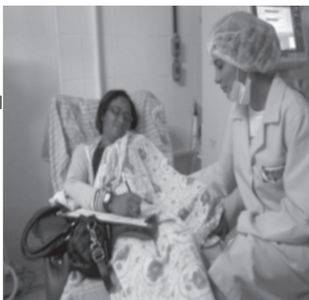
Aluna voluntária da Unifor em atendimento a paciente da Policlínica do Rim

A Insuficiência Renal Crônica (IRC) é caracterizada por uma perda da função renal, que ocorre de forma lenta e gradual até o ponto em que os rins não se mostram mais capazes de executar suas funções normais, de excretar as toxinas, de manter o equilíbrio corporal da água e eletrólitos e de produzir hormônios. Muitas vezes, os sintomas inexistem