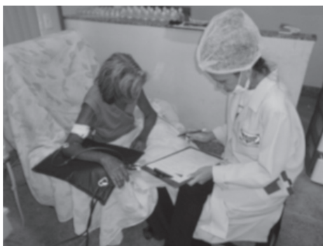
Aluna voluntária da Unifor em atendimento a paciente da Policlínica do Rim

Esse trabalho vem sendo executado dentro do enfoque experimental, utilizando recursos da Psicopedagogia na ação pedagógica, facilitando o processo ensino aprendizagem dentro do ambiente da clínica de hemodiálise.