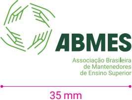
Versão principal completa