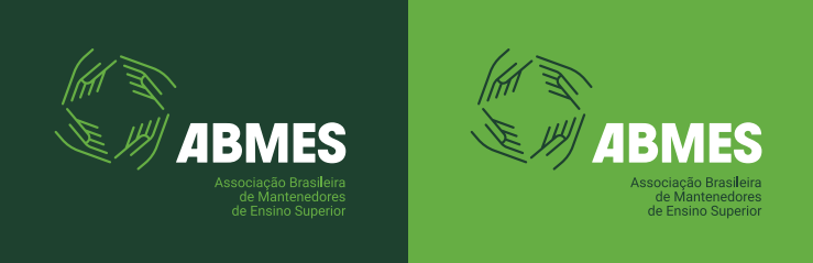
Versão principal completa negativa