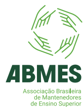
Versão vertical completa