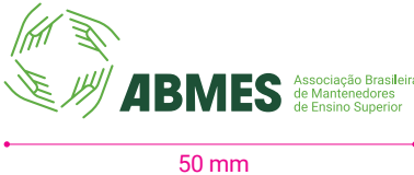
Versão horizontal completa