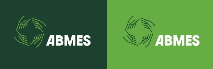
Versão principal simplificada negativa