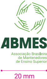
Versão vertical completa