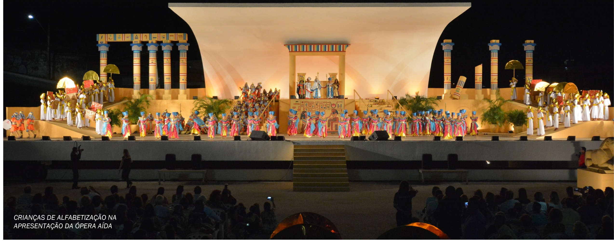
CRIANÇAS DE ALFABETIZAÇÃO NA APRESENTAÇÃO DA ÓPERA AÍDA