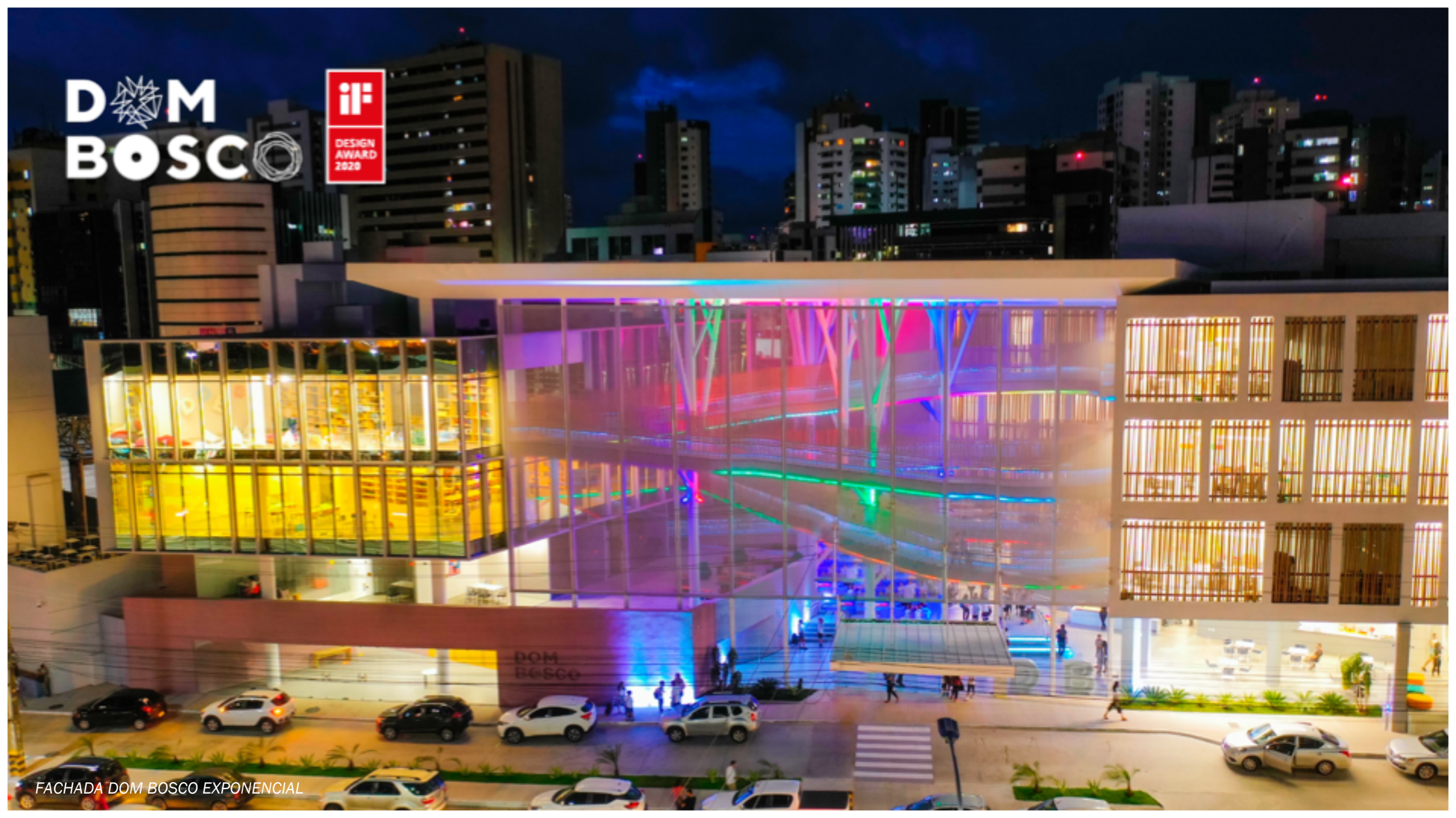
FACHADA DOM BOSCO EXPONENCIAL