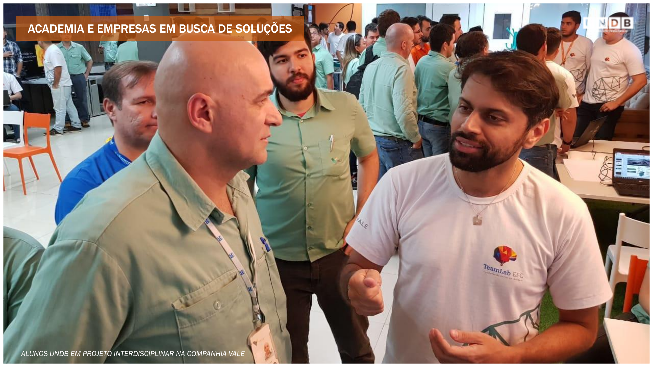
ALUNOS UNDB EM PROJETO INTERDISCIPLINAR NA COMPANHIA VALE